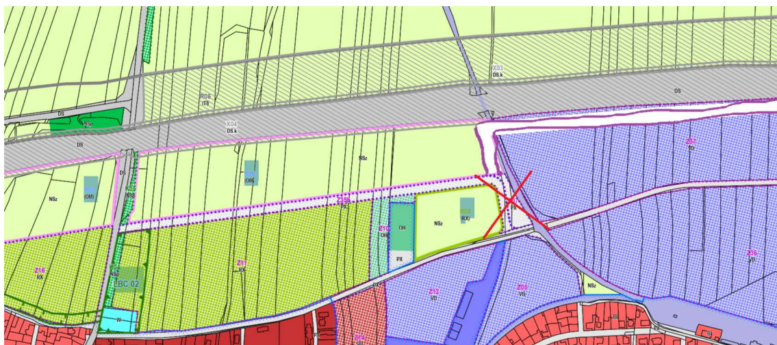
Obrázek 1 Změna nového územního plánu